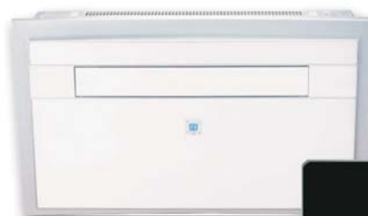
IQ Monoblocco a pavimento Oldalfali monoblokk Monobloc floor