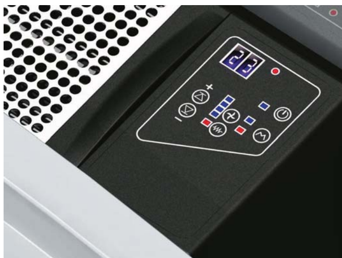
Kezelőfelület (su IQ-32)