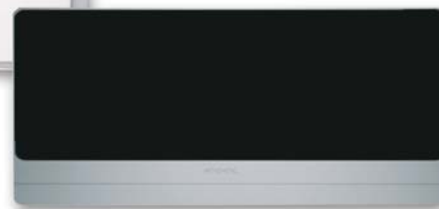
iCOOL Monoblocco a parete Magasoldalfali monoblokk Monobloc wall

Üzemi határértékek: Hűtés: 10/52°C B.S. Fűtés: -5 ~ 24°C