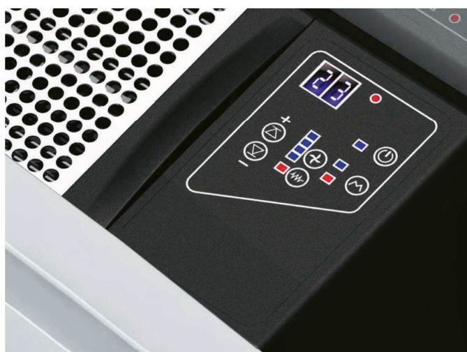
Kezelőfelület (su IQ-32)