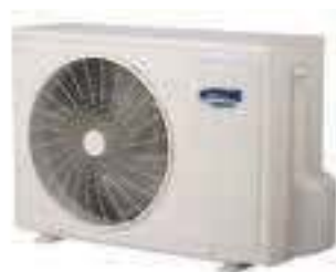
UNITÀ ESTERNA KÜLTÉRI EGYSÉG - OUTDOOR UNIT