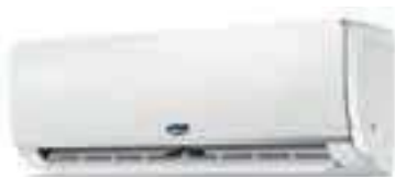
UNITÀ INTERNA BELTÉRI EGYSÉG - INDOOR UNIT